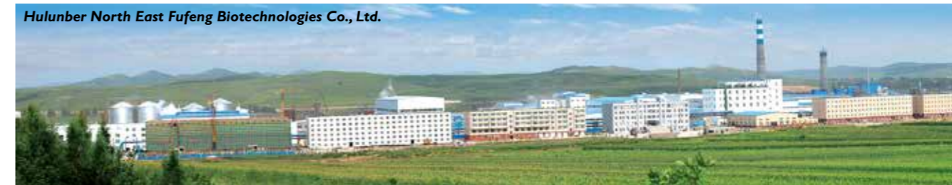
Hulunber North East Fufeng Biotechnologies Co., Ltd.