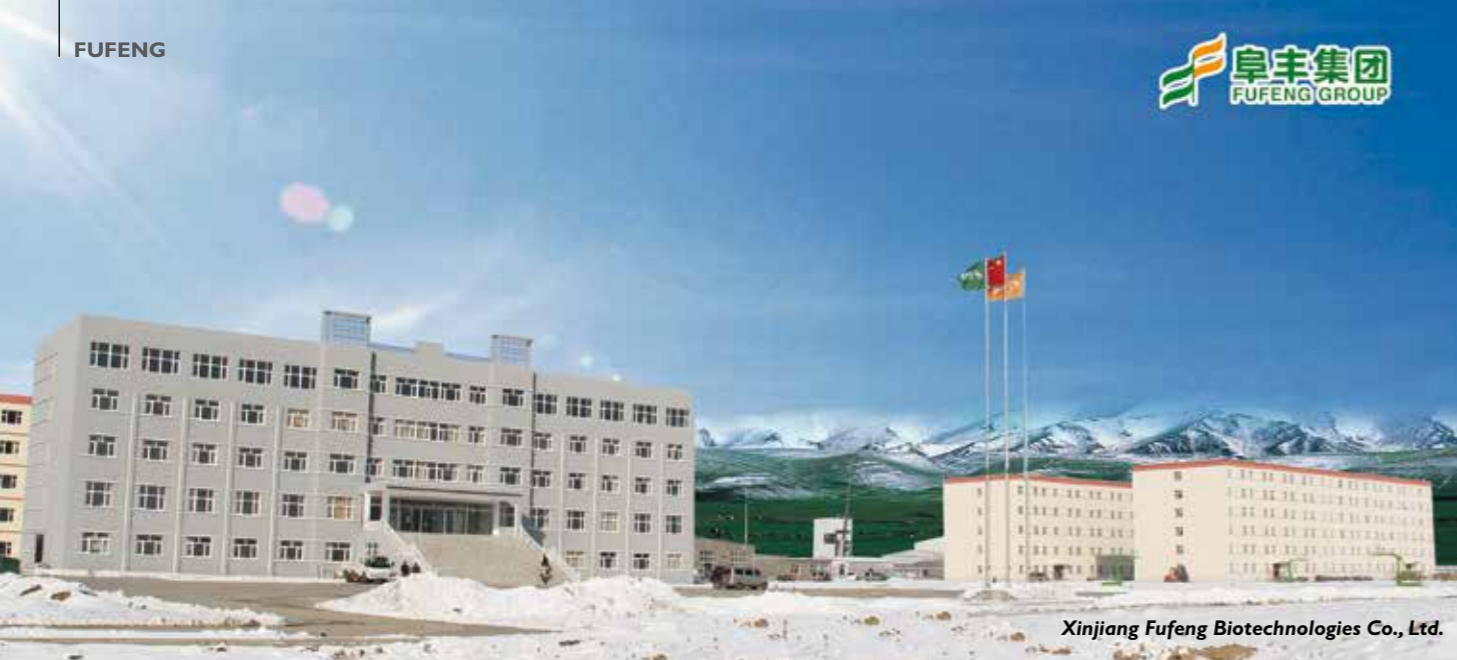
Xinjiang Fufeng Biotechnologies Co., Ltd.