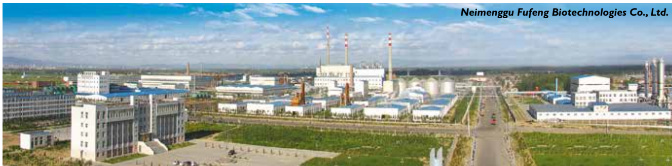
Neimenggu Fufeng Biotechnologies Co., Ltd.

deia nacional de produção de produtos de biofermentação. Em março de 2004, o Grupo deu início a implementação da Baoji Fufeng Biotechnologies Co., Ltd. na província de Shaanxi, um projeto de transformação de 250 mil toneladas de milho. Em 2005, a Fufeng expandiu a segunda etapa do projeto, em 100 dias, criando um verdadeiro milagre do desenvolvimento econômico local em Baoji.