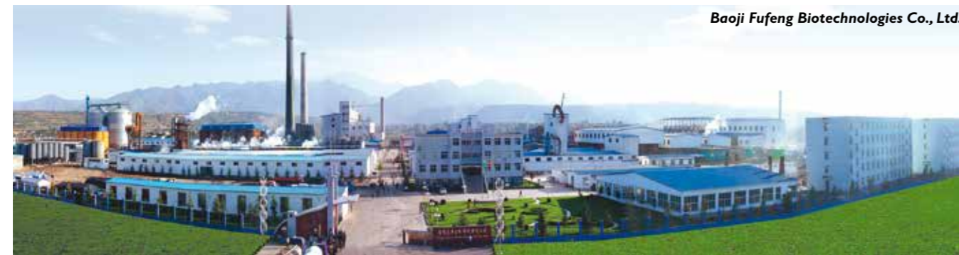
Baoji Fufeng Biotechnologies Co., Ltd.