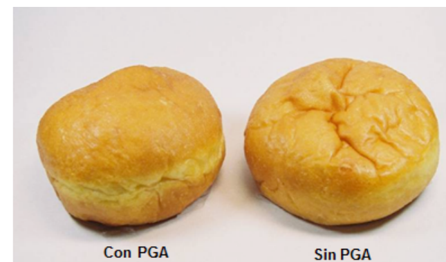
FIGURA III - EFEITO DO PGA NO VOLUMEN E SUPERFÍCIE

Produtos com PGA têm formato mais definido e superfície mais lisa e definida.