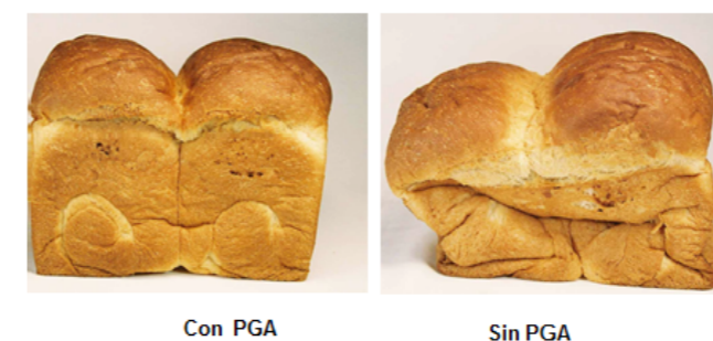
FIGURA I - EFEITO DO PGA APLICADO EM PÃO COM FARINHA DE ARROZ (GLÚTEN FREE)

Outros dois fatores a se levar em consideração são: substituição total de glúten por PGA, para produção de pães e bolos sem glúten, para dietas com restrições ao glúten e substituição do glúten adicionado para fortalecimento da farinha.